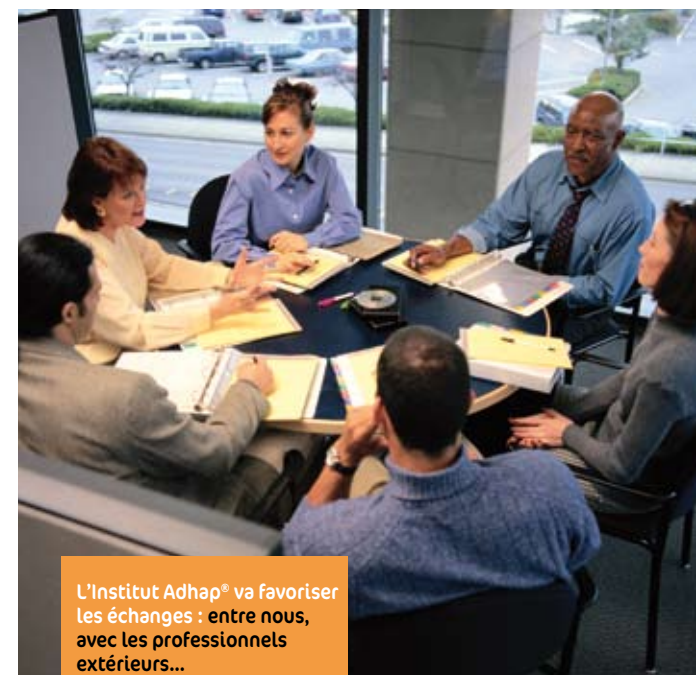
L'Institut Adhap® va favoriser les échanges : entre nous, avec les professionnels extérieurs...