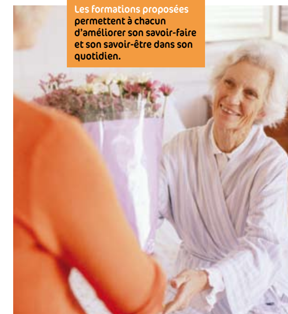
Les formations proposées permettent à chacun d'améliorer son savoir-faire et son savoir-être dans son quotidien.

3 - Pour les assistantes en contact régulier avec des malades. Cette formation a pour objectif d'aider les assistantes à mieux comprendre le comportement des malades, à s'adapter aux différents cas, à rechercher leur bien-être, à animer les activités spécifiques.